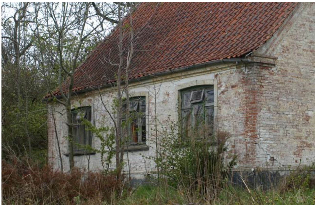
Hvem skal bestemme hvordan tingene skal se ud, og hvem skal eventuelt gribe ind?